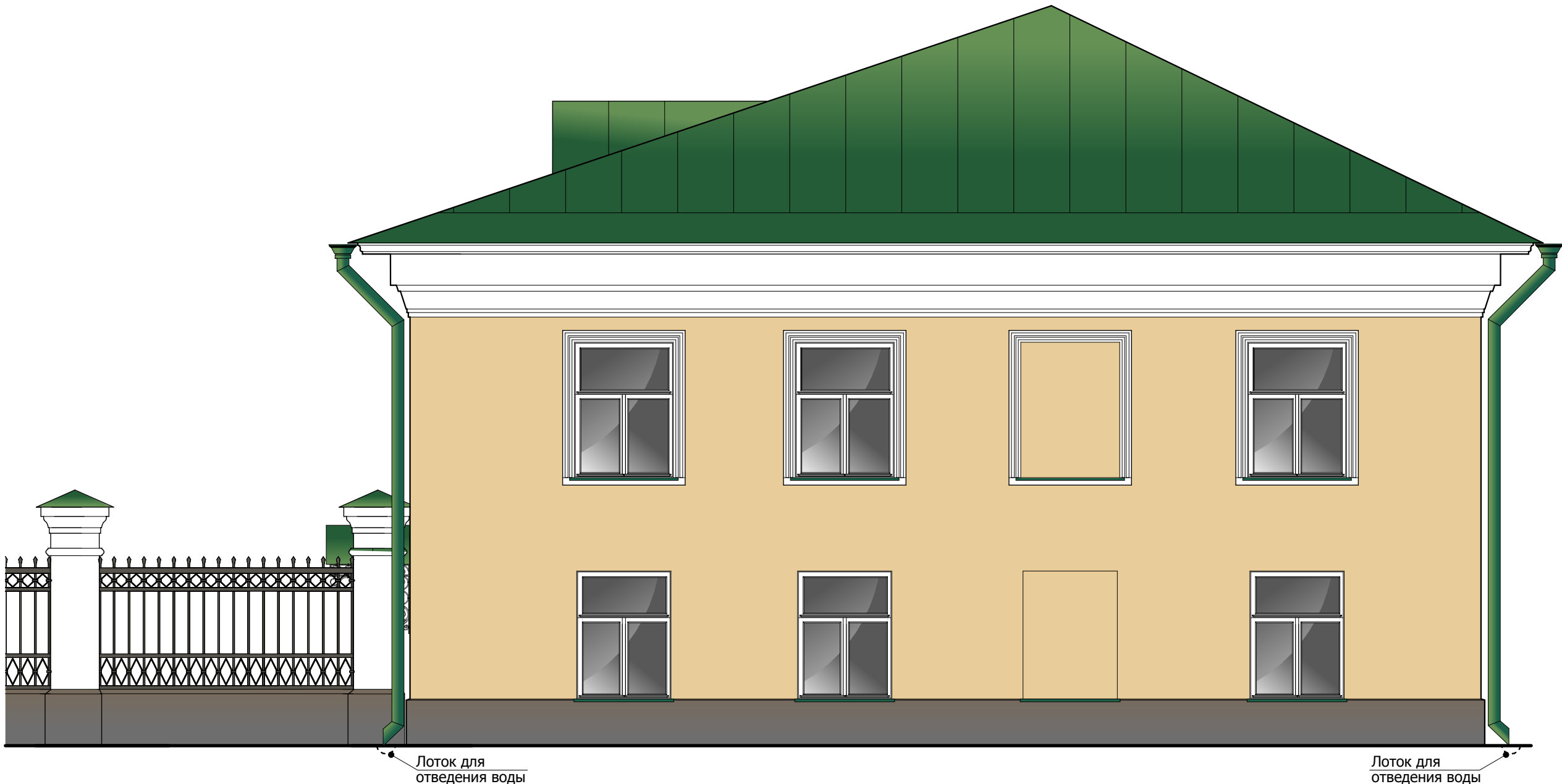
Юго - западный фасад . М 1:50