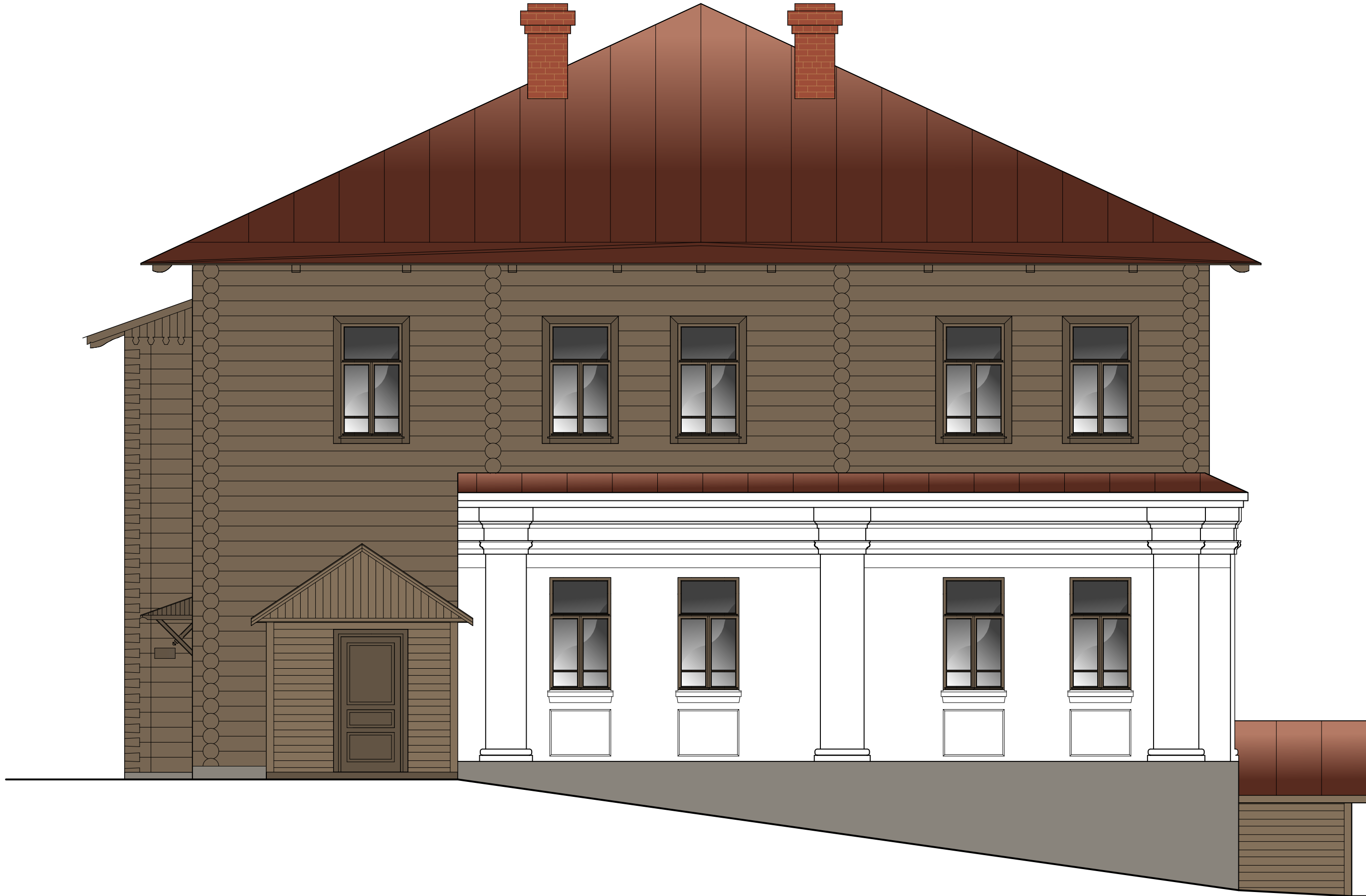
Западный фасад М 1:50