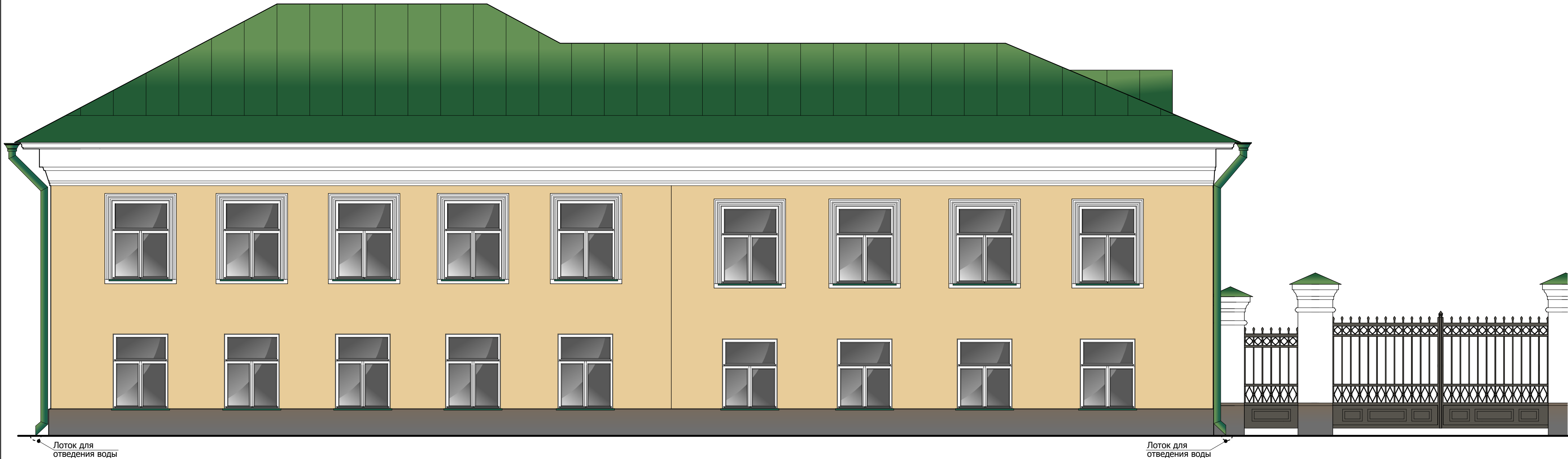
Главный фасад по ул. Шагова. М 1:50